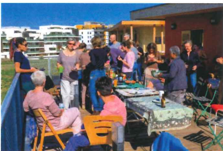
Un repas partagé sur la terrasse commune

Ce type de projet est une vraie aventure humaine. Pour s'engager dans un projet comme cela, il faut bien définir ce que l'on veut et savoir se positionner dans le collectif.